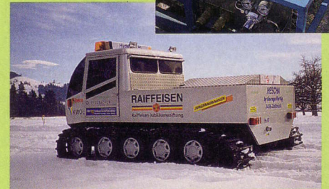
Start zur ersten abgasfreien Pistenpräparierung im Alpenraum.

Das auf Wasserstoff-Betrieb umgebaute Pistenfahrzeug hat vor kurzem die ersten Spuren im Schnee gemacht. Mitte 2003 gehörte dieses vom Verein Swiss Alps 3000 lancierte Projekt zu den Prämierten des von EnergieSchweiz unterstützten „prix pegasus“. Nun sollen Erfahrungen gesammelt werden mit dem CO 2 -frei betriebenen Fahrzeug. Als Vision wird die Umrüstung von rund 1000 Pistenfahrzeugen bis 2013 angestrebt.